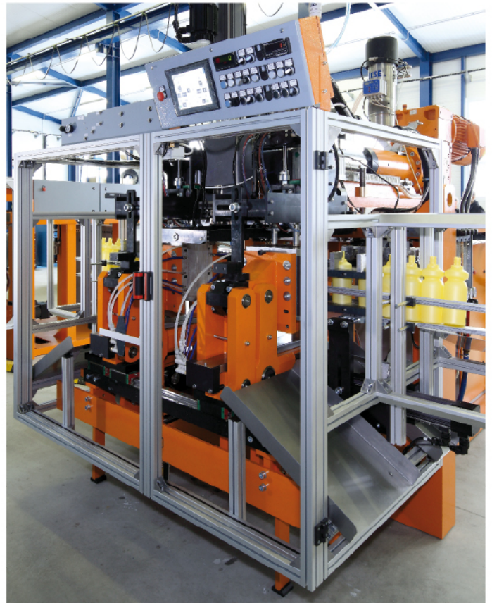
Dimensiones del molde (mm)

GDK, República Checa, 362 14 Kolová 181 tel. / fax +420 353 331 391, www.gdk.cz